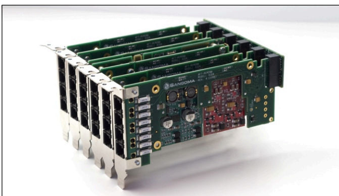
Configuração máxima - total de 24 portas

A placa A200 de 4 portas FXO/FXS da Sangoma oferece superiores qualidades de áudio, com um limite máximo de 24 portas em um fator de forma 2U, com supressão de eco da operadora opcional.